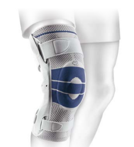
GenuTrain® S / S Pro

Hilfsmittelnummer 23.04.03.0014 23.04.03.1045