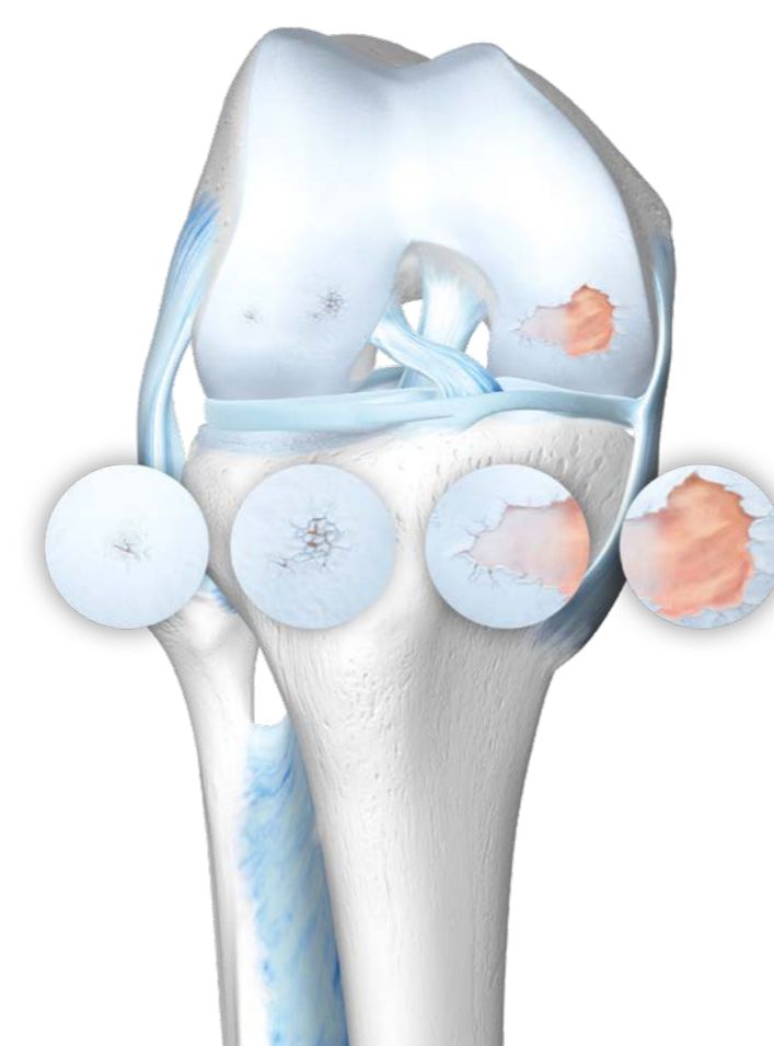
Gonarthrose Stadium I–IV