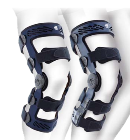
SecuTec® Genu frontal / dorsal

Gezielte Entlastung und Stabilisierung für mehr Aktivität bei Gonarthrose